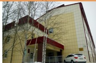
Сургутская городская клиническая больница, ожоговое отделение, приемный покой

Если тебе плохо и ты нуждаешься в медицинской помощи, то тебе помогут здесь: